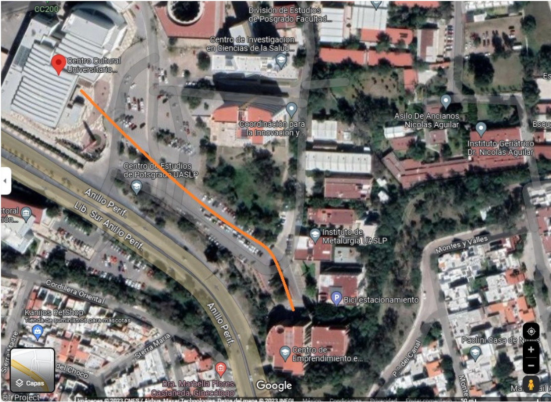
Mapa: Conexión Centro de Emprendimiento e Innovación Potosino y Centro Cultural Bicentenario